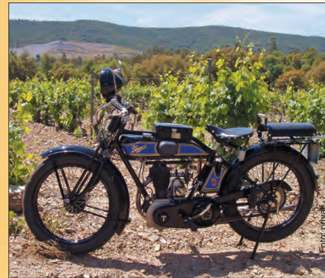
Terrot treffen met show vanaf vrijdagmiddag